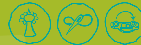
Städtisch Gärtnern Näherwerkstatt, Repair Cafés & Co Verkehr neu denken