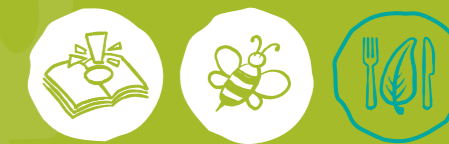
Umweltwissen sammeln Artenvielfalt-Tiere schützen Nachhaltige Ernährung