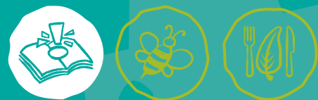
Umweltwissen sammeln Artenvielfalt-Tiere schützen Nachhaltige Ernährung