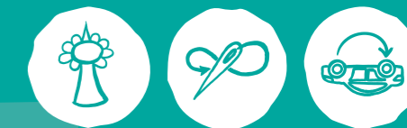
Städtisch Gärtnern Nachwerkstatt, Repair Cafés & Co Verkehr neu denken