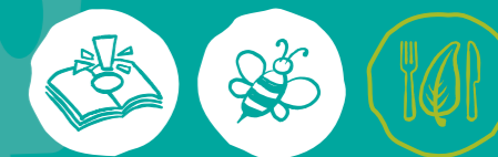
Umweltwissen sammeln Artenvielfalt-Tiere schützen Nachhaltige Ernährung