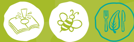
Umweltwissen sammeln Artenvielfalt-Tiere schützen Nachhaltige Ernährung