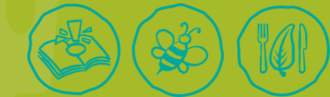
Umweltwissen sammeln Artenvielfalt-Tiere schützen Nachhaltige Ernährung