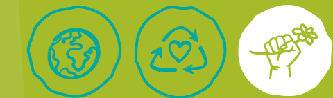
Global engagieren Müll vermeiden Klima- und Umweltschutz

MINDESTALTER DER FREIWILLIGEN: ab 18 Jahren