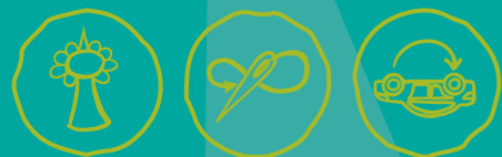
Städtisch Gärtnern Näherkstatt, Repair Cafés & Co Verkehr neu denken