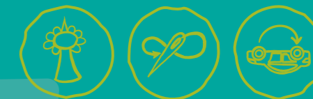
Städtisch Gärtnern Näherwerkstatt, Repair Cafés & Co Verkehr neu denken