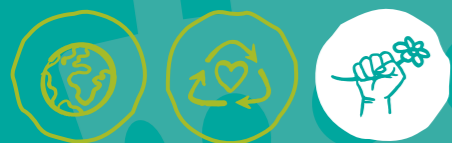
Global engagieren Müll vermeiden Klima- und Umweltschutz

MINDESTALTER DER FREIWILLIGEN: ab 18 Jahren