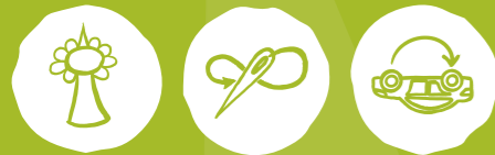
Städtisch Gärtnern Näherwerkstatt, Repair Cafés & Co Verkehr neu denken