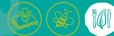
Umweltwissen sammeln Artenvielfalt-Tiere schützen Nachhaltige Ernährung