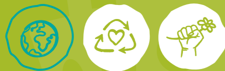
Global engagieren Müll vermeiden Klima- und Umweltschutz

MINDESTALTER DER FREIWILLIGEN: ab 18 Jahren