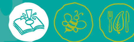
Umweltwissen sammeln Artenvielfalt-Tiere schützen Nachhaltige Ernährung