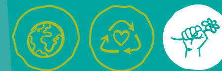
Global engagieren Müll vermeiden Klima- und Umweltschutz